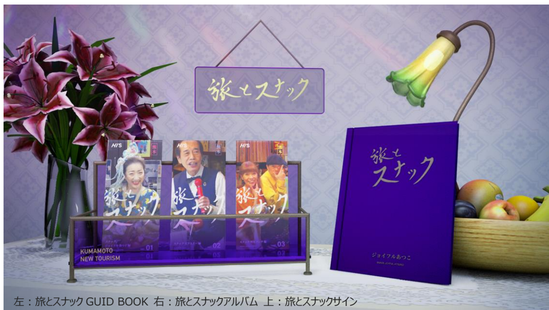
左：旅とスナック GUID BOOK 右：旅とスナックアルバム 上：旅とスナックサイン