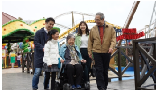
(次世代型電動車椅子イメージ)

なお、園内ではユニバーサル計画の一環として、一部の石畳をレンガ敷きにする改修工事も進めております。2021年4月からは次世代型電動車椅子「WHILL (ウィル)」のレンタルも開始しております。運河船や園内バスなど以外にもさまざまな移動手段の選択肢をご活用ください。今後も、幅広い世代のお客様に安全で快適な散策をお楽しみいただけますよう改善改良を図ってまいります。