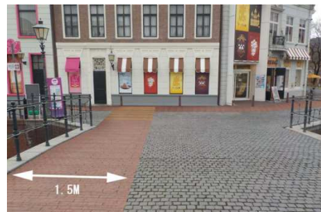
(一部園内改修場所)

【お客様のお問い合わせ先】 ハウステンボス総合案内ナビダイヤル：0570-064-110