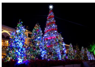
<クリスマスツリー>

「ジョイアマーレの浜辺」にカラフルに輝くクリスマスツリーが登場。クリスマスツリーを舞台に行われる点灯式で園内のイルミネーションが一斉に点灯します。