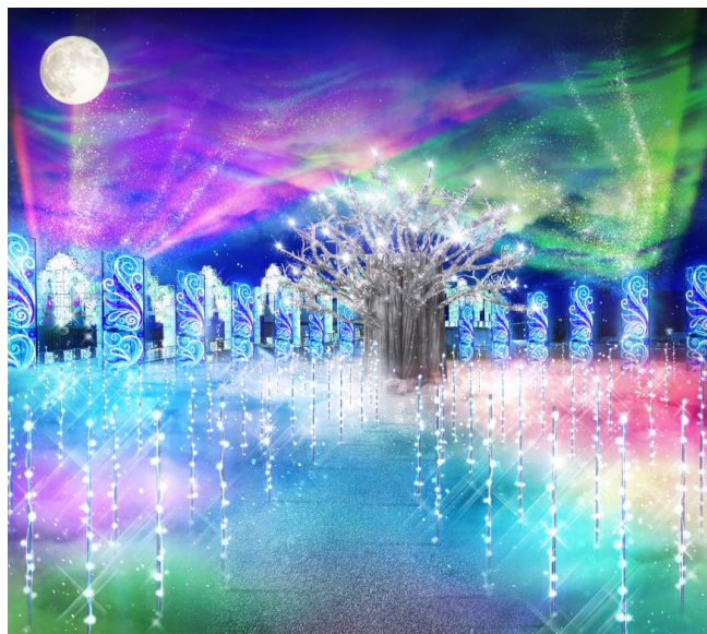
▲Tree in the sky～天空に宿る生命(いのち)の光 ※イメージ