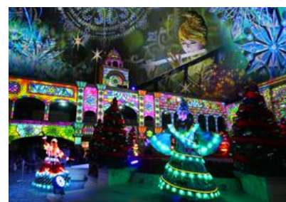
<360° 3D マッピング 「NEIGE（ネージュ）」>

360°で繰り広げられる3Dマッピングの冬季限定バージョン。氷の世界や可愛らしいお菓子の家を表現したプロジェクションマッピングとショーキャストがコラボレーションしたショーです。