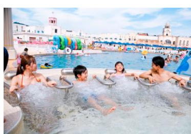
プールで冷えた体を温めて 休憩できる温水ジャグジー 「セイレーンの泉」