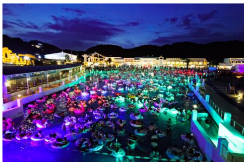
「ジョイアマーレの浜辺」