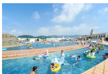
幅広い年齢が楽しめる ラグナシア定番の全長230mの 流れるプール 「ウロボロスの河」