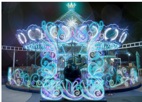
② ステラ イルミネーション 【フォトスポットが新登場!】

お子さま向けのアトラクションエリア「ステラパーク」もファンタジー溢れる世界に。今年は新たに数々のフォトスポットが登場し、冬の思い出作りにおすすめです。