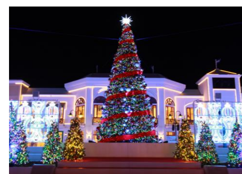
⑦ クリスマスツリー

ラグナシア全体を見渡すことが出来るテラスの天井には、まるでステンドグラスのようなイルミネーションが広がり、やわらかい光が降り注ぎます。