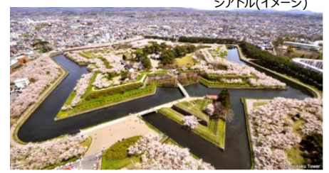
函館・五稜郭公園 イメージ

今年も沖縄が不動の1位となりました。3月25日より中部から宮古島、福岡から石垣島へ全日空による直行便運航が通年を通じ開始したこともあり、沖縄への国内旅行の需要が更に高まっています。6月には福岡から宮古島、7月には、関西から宮古島、石垣島への季節運航が決まっていることから、今後も引き続き沖縄人気の盛り上がりが見込まれます。2位にランクインした北海道は、GWに桜の開花が見頃を迎えることから、“この時期にしか見られない春色の北海道”として春の北海道を販促したことが功を奏しました。