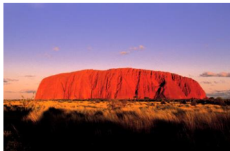
ウルル（エアーズロック）イメージ

調査対象：H.I.S.の海外ツアー・航空券（予約数 100 名以上より） 対象出発日：2018年4月28日～5月6日