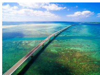
宮古島・伊良部大橋 イメージ