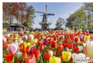
アムステルダム イメージ