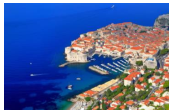
クロアチア・ドブロブニク イメージ