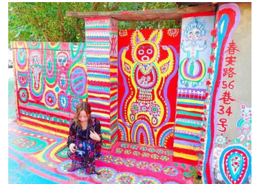
彩虹眷村

今後も各方面で投票キャンペーンを実施し、ランキング結果から、その地の新たな魅力をお伝えすることで、新しい旅先のご提案に繋がればと考えております。