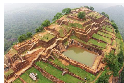
スリランカイメージ