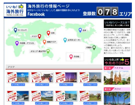
右：いいね! 海外旅行 イメージ

本件に関するマスコミからのお問い合わせ先 株式会社 エイチ・アイ・エス 広報担当 TEL: 03-5908-2346 FAX: 03-5908-2187 営業時間 平日)10:00～18:30、土日祝) 休み