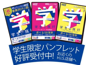
パンフレット イメージ

■ 学生ページURL: http://www.his-j.com/gakusei/