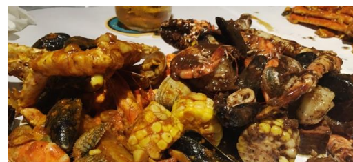
▲クラッキン・キッチン ((イメージ)