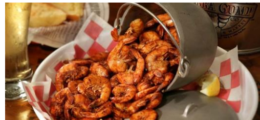
▲パパ・ガンブ(イメージ)