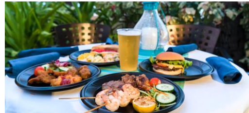
▲レアレアバーベキュー(イメージ)