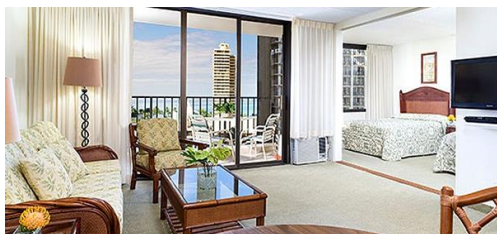
▲アストン アット ザ ワイキキ バニアン ((イメージ)

幼稚園児(3～6歳)のお子様を持つお母さんに人気だったホテルは、「アストン アット ザ ワイキキ バニアン」を始めとするキッチン付きのコンドミニアムタイプのリゾートです。毎食、レストランで食べるより、簡単にお部屋で調理したり、時間に関係無くリーズナブルにゆっくり食べられる点が嬉しいという声を集めました。レストラン編では、色々なものに興味を持ち、気が散りやすい幼稚園児には、料理が運ばれるまでの間、遊べるコンテンツがあると安心ということで、お子様用の塗り絵や椅子を提供してくれるレストランがお勧めとして票を集める中1位に輝いたのは「パパ・ガンブ」でした。