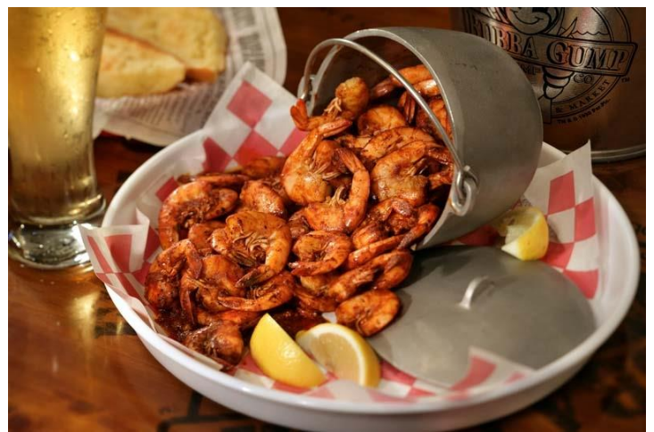
▲幼稚園児がいるご家族にお勧めのレストラン第 1 位 パパ・ガンブ(イメージ)

【H.I.S.SNS 旅トレンド調査】SNS でハワイ好きが決めた！ファミリーで泊まりたい&行きたい！