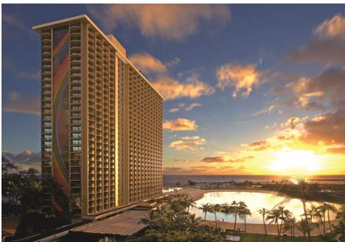
▲小学生がいるご家族にお勧めのホテル第 1 位 ヒルトン・ハワイアン・ビレッジ(イメージ)