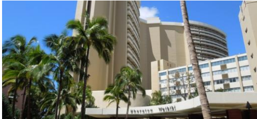
▲シェラトンワイキキホテル(イメージ)

幼児(0～2歳)のお子様は体調を崩しやすい為、いざという時に安心という理由でホテル内に託児所や診療所がある「シェラトン ワイキキ ホテル」が人気でした。また、まだお子様が小さいので、2位に「ハレクラニ」、3位に「アウトリガー リーフ ワイキキ ビーチ リゾート」とご両親の意向がより反映された結果となり、幼稚園児や小学生のご家族に比べて比較的高級ホテルが上位にランクインしたのが特徴的です。また、レストラン編では、食事だけでなくフラダンスショーなどの催しがあり、小さなお子様も食事とショーと一緒に楽しめるという事で、ヒルトン・ハワイアン・ビレッジの屋外で行われる「レアレアバーベキュー」が1位に輝きました。