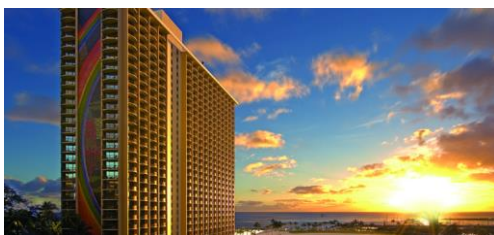
▲ヒルトン・ハワイアン・ビレッジ ((イメージ)

小学生(7～12歳)のお子様を持つお母さんに圧倒的な人気を誇ったのが、ワイキキのランドマーク的存在の「ヒルトン・ハワイアン・ビレッジ」です。4本ものスライダーがある充実のプールや、90を越えるショップなど、リゾート内で全てが完結できる充実さが好評でした。また、レストラン編ではテーブルの上に広げられたシーフードを大人も子供も手づかみで食べる「クラッキン・キッチン」で、みんなでワイワイ楽しみながら食べられるという点で人気でした。