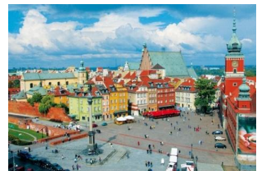
(ポーランド イメージ)

また、昨年からの伸び率ランキングをみると、1 位にはベトナムの新しいリゾートとして特に女性に人気の「ダナン」が入り、2 位には 2016 年 1 月から成田より直行便が新規就航したことで知られていなくてもったいない国といわれる「ポーランド」や、以下、有名テーマパークのあるアメリカ カリフォルニアの「アナハイム」、新しいリゾートホテルが次々と建設されている「マカオ」などがランクインしております。5 位のゴールドコーストに続き、6 位以下にもメルボルンやケアンズなど、日本と季節が逆の南半球に位置するオーストラリア各都市の人气が上昇しているのも注目です。ヨーロッパにおいては、フランス同時多発テロでの影響はあるものの、スペイン・イタリア・ドイツは好調に推移しております。