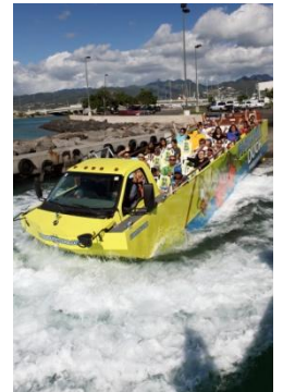
(ハワイ 水・陸両用バス“ダック” イメージ)

定番のハワイにおいては、到着時の空港に、水・陸両用バス“ダック”がお出迎えし、海からワイキキに向かうなど、ハワイ到着後から人とは違う体験ができるプランが人気です。またグループ旅行ランキング4位にランクインしたインドネシア・バリ島では、今年の傾向として、特にグループでの参加が多いのが目立ち、中でもプライベート空間を保ちながらもみんなで楽しめるヴィラ1棟を貸し切り滞在するプランの人气が高まりつつあります。「せっかくなのでみんなで同じ部屋に泊まりたい。」「別荘のように部屋は別でも、同じリビングで盛り上がりたい」などの意見をいただき反映した商品が、3ベッドルームが備わるプライベートプール付き一軒家ヴィラに宿泊するコースです。3ベッドのご用意があるヴィラでは、最大9名様まで宿泊でき、ヴィラ内には、SNSの更新には欠かせないWi-Fiも無料でご利用いただけます。滞在中は日本人スタッフのサポートだけでなく、専属のバトラーサービスもつくなど食べ物や飲み物の買い出しのお手伝いも可能です。大切な友人との時間を思う存分ゆったりと、贅沢にお楽しみいただけることから注目が集まり非常に好調に推移しております。ハワイ等のリゾート地と比較した際にお得感を感じられることも支持を得ている理由の一つであると考えられます。