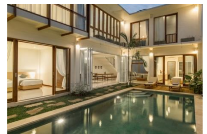
(バリ島 3ベッドルームヴィラ イメージ)