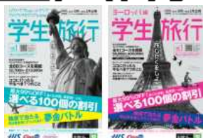
(対象パンフレット)