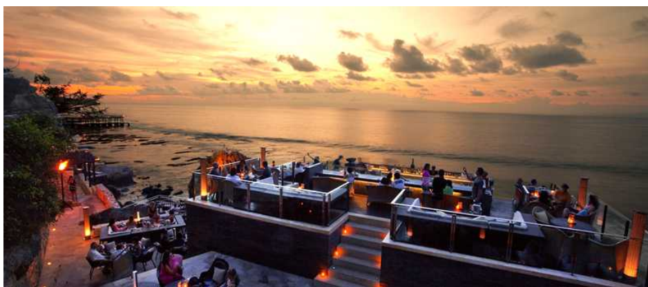
▲アヤナ リゾート&スパ バリのロックバー（イメージ）

夏旅ホテル総選挙 2015 一度は泊まりたい！憧れの海外ホテル： http://bit.ly/1FsLwKn