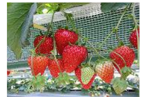
いちご狩り(イメージ)