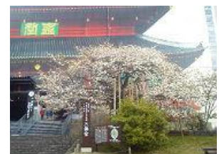
輪王寺桜祈願(イメージ)