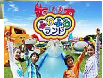
国内旅行 (イメージ)

※空席には限りがございます。空席があれば、出発日の7日前の営業時間まで受付可能。