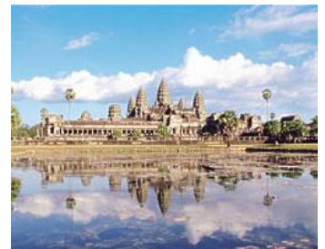
アンコールワット (イメージ)