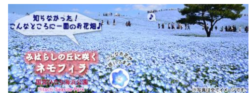
ひたち海浜公園 (イメージ)