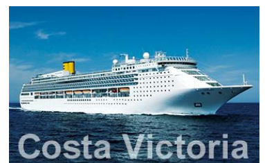
コスタビクトリア号 (イメージ)

(URL: http://conze3.wisebook.jp/bookstore/viewer/hiskanto/1925/#5 )