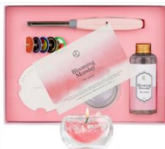
EVENDAY パフューム リキッドキャンドル 常温では固まらない液体キャンドル。油煙・引火性・揮発性が少なく安全性にも優れています。