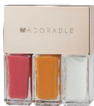
ADORABLE ビーガンネイルポリッシュ 動物製品・有害物質を使用せず動物実験を行っていない、爪にも地球にもやさしい話題の「ビーガンネイル」。

韓国でしか買えない商品が大集合。韓国で今人気沸騰のビーガンコスメやネイルケア商品をはじめ紙工芸体験キット、雑貨等、様々なカテゴリーの商品がご購入いただけます。