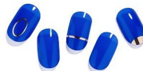
SENSIBLEブルーネイル 手軽に楽しめ、チェンジも簡単。気軽に爪先を彩れる人気アイテム。デザイン・色、豊富な種類をご用意。