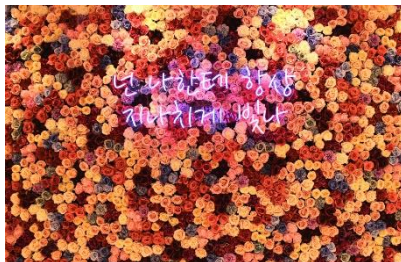
フラワーウォールにはドラマの有名なセリフが