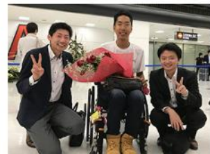
三代さん 世界一周旅行の様子