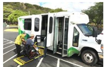
「リフト付き車両」イメージ

昨今観光庁でも、誰もが安心して旅行を楽しめ、高齢や障がい等の有無にかかわらず、誰もが気兼ねなく参加できる旅行『ユニバーサルツーリズム』を普及・促進する方針が掲げられております。また、2020年オリンピック・パラリンピックを見据えたユニバーサルツーリズムへの対応について「高齢の方・障害のある方などをお迎えするための接遇マニュアル」が作成されるなど、高齢社会が進み、今後高齢者やおからだの不自由な方が一層増えることが想定される今、ユニバーサル社会環境を、日常生活の中で浸透させていくためには、バリアフリーなどのハード面での正しい情報に加え、ソフト面であるマナーや対応を学ぶことが不可欠になりつつあります。