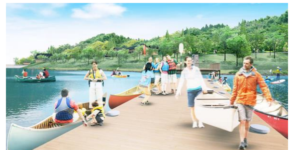
metsä village Laituri ボート乗り場・桟橋(イメージ)