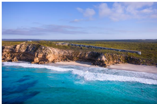
■オーストラリア旅行における最大の魅力