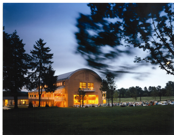
タングルウッド セイジ・オザワホール

また、2016 年はモーツァルト生誕 260 周年を迎えます。モーツァルトの生誕地オーストリア・ザルツブルクで毎年行われる「ザルツブルク音楽祭」は期間中に数十万人が訪れ、出演者の顔ぶれや公演の質・量ともに世界最大規模の音楽祭です。クオリタ音楽鑑賞デスクでは、モーツァルトのオペラの代表作「ドン・ジョヴァンニ」「コジ・ファン・トゥッテ」の人気 2 作品、交響曲は 3 大交響曲とも呼ばれる、第 39 番、第 40 番、そして第 41 番「ジュピター」の 3 曲を一度に鑑賞するツアーを発売しました。音楽鑑賞専門デスクは、音楽が好きなハネムーン、60～70 代層、親子旅など様々なお客様にご利用いただいております。