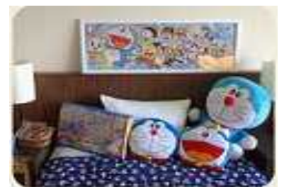
（映画ドラえもんルーム イメージ）

さらに、参加者全員に、映画ドラえもんの歴史や、旅をより楽しくする「ドラえもん南の島大発見ハンドブック」などをプレゼントいたします。お子様・ファミリー、そしてカップルや友だち同士でも楽しめ、みんなが笑顔になり、思い出に残る充実した沖縄の旅をお楽しみいただければと考えております。