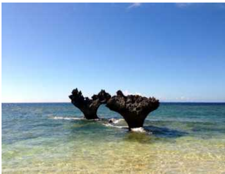
（ティヌ浜 ハート型岩 イメージ）

今回 H.I.S.がご用意した「ドラえもん 35（サンゴ）ビーチ」は、古宇利島にありながらも、観光として訪れる方法は地形的に船でしか行くことが出来ないエリアにあります。今回、35周年企画としてサンゴ礁に囲まれ手つかずの自然が残る美しい入り江を「ドラえもん 35（サンゴ）ビーチ」とし、沖縄の美しい海やマリナクティビティをお楽しみいただいたり、10名程度の小型船で古宇利大橋をくぐったり、ハート型の岩を海から眺めたりと島をぐるりと一周する「古宇利アイランド一周クルーズ」をご用意しました。