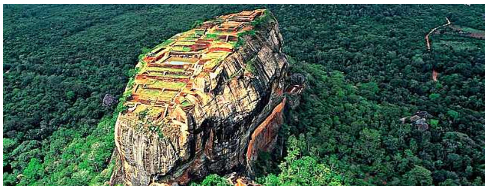
(シギリヤロック イメージ)

近年、モバイル技術の進化により、SNS における動画の投稿／閲覧が飛躍的に伸びていると言われております。弊社の公式 SNS ページにおきましても、海外現地情報・CM・キャンペーン紹介など動画の投稿は、「いいね」などによる反応数の増加が顕著です。最近では、無人飛行機ドローンで空撮したスリランカの世界遺産・天空の古代宮殿跡「シギリヤロック」の動画投稿が多くの反響を頂き、公式 Facebook ページ H.I.S.JAPAN にて、人気観光地のハワイなどを抑え動画再生数 No.1 となりました。