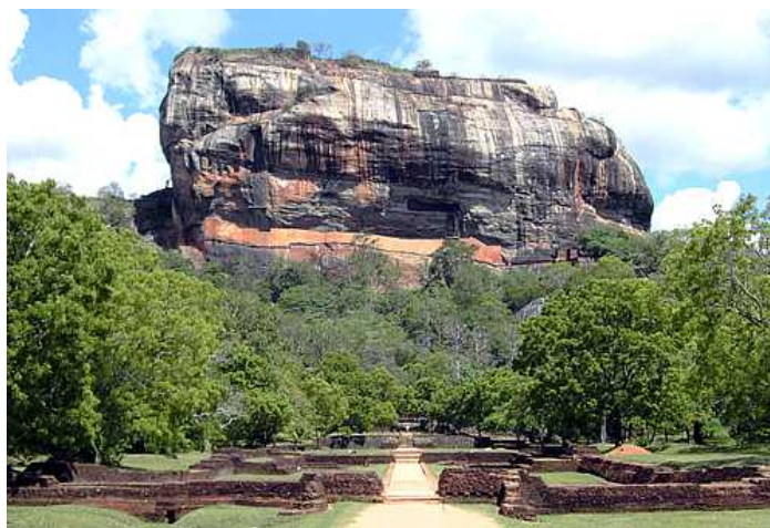
(シギリヤロック イメージ)