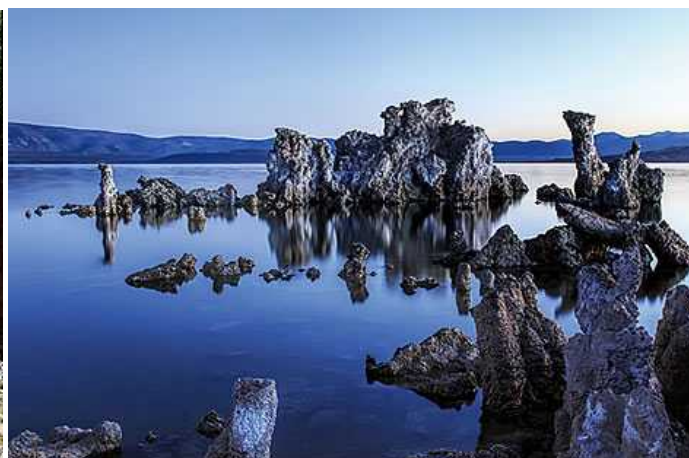
(奇妙な岩が並ぶモノ湖)