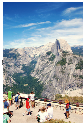
(ヨセミテ国立公園)

7/16、9/16：860,000 円 8/5：920,000 円 8/26：880,000 円 9/9：840,000 円 9/23：820,000 円