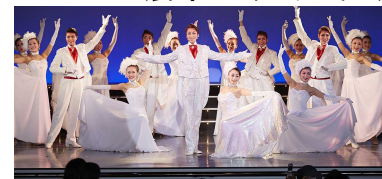
（ハウステンボス歌劇団）

商品ページ： http://www.his-j.com/tyo/cruise/index.htm