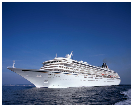
（飛鳥 II 外観）

旅行代金にはクルーズ中、及び各コースの全てのお食事、船内イベントの鑑賞料金も含まれており、「洋上のオアシス」と謳われる飛鳥 II クルーズを最短3日からと身近にご体験頂ける内容となっております。H.I.S.では、クルーズ旅行が今後さらに身近に、そして気軽に楽しんで頂けるよう、積極的に取り組んでまいります。