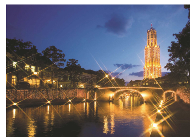
（長崎／ハウステンボス）