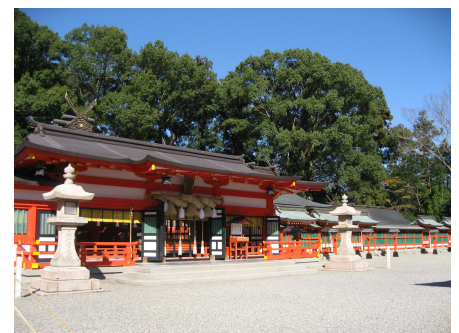
(熊野速玉大社 イメージ)