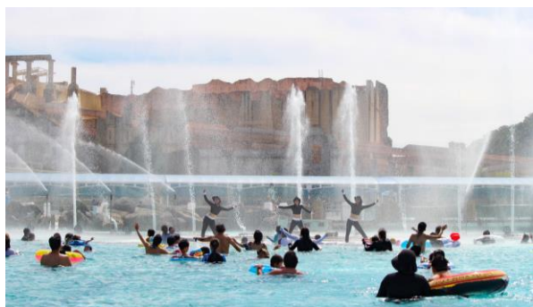
噴水ショーや花火スペクタキュラが 間近で見られるセンタープール 「ルナポルト」