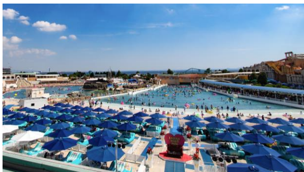
日本最大級 最大波高 1m の 波が出るプール 「ジョイアマーレの浜辺」