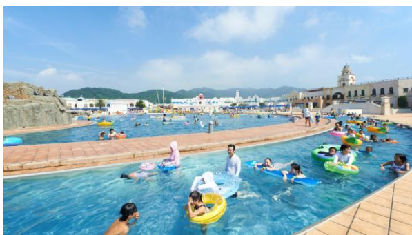
ラグナシア定番 全長 230m の 流れるプール 「ウロボロスの河」