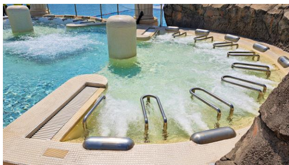
プールで冷えた体を温めて 休憩できる温水ジャグジー 「セイレーンの泉」