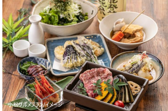
小松グルメプラン/イメージ