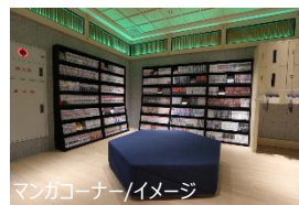
マンガコーナー/イメージ