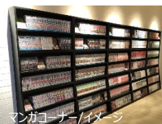
マンガコーナー/イメージ