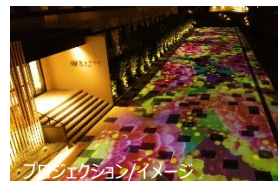
プロジェクション/イメージ

所在地：〒923-0868 石川県小松市日の出町 1-180 電話：050-5210-9990