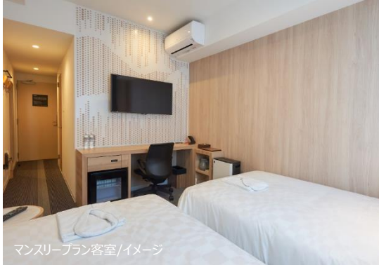
マンスリープラン客室/イメージ

H.I.S.ホテルホールディングス株式会社（本社：東京都港区）が運営する「変なホテル 小松駅前」は、宿泊者の入れ替わりが可能な 30 泊 31 日のマンスリープランと、地元飲食店とコラボレーションした小松グルメプランを、本日 7 月 21 日（金）より発売いたします。