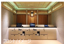
フロント/イメージ

最短 10 秒でチェックインが完了する「エクスプレスチェックイン」を導入しております。全客室に、衣類のしわやにおい・ウイルスを除去できるクリーニングマシン「LG スタイラー」を設置し、客室の水には世界中のアスリートから支持をうけるファイテン社のプレミアムな水「ファイテンウォーター」を採用いたしました。ロビーには無料でご利用いただける約 1,800 冊のマンガコーナーや、スタッフを介することなくお客様のご都合にあわせて無料でお荷物を預けていただけるバゲッジポートを設置しております。