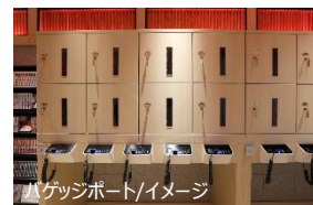
バゲッジポート/イメージ

所在地：〒460-0003 愛知県名古屋市中区錦 1-10-10 電話：052-223-0170