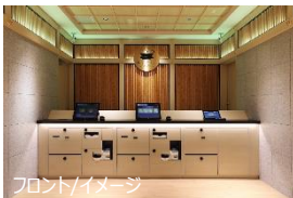
フロント/イメージ

最短 10 秒でチェックインが完了する「エクスプレスチェックイン」を導入しております。客室はツイン・ダブルタイプに加えて、スイートルームやベッドを 4 台設置した約 40 m 2 と広めの客室もございます。全客室に、衣類のしわやにおい・ウイルスを除去できるクリーニングマシン LG スタイラーを設置し、客室の水には世界中のアスリートから支持をうけるファイテン社のプレミアムな水「ファイテンウォーター」を採用いたしました。ロビーには無料でご利用いただける約 1,800 冊のマンガコーナー、スタッフを介することなくお客様のご都合にあわせて無料でお荷物を預けていただけるバゲッジポートを設置しております。