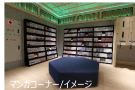
マンガコーナー/イメージ