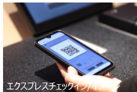
エクスプレスチェックイン/イメージ