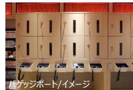
バゲッジポート/イメージ