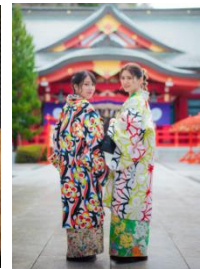
着物レンタル/イメージ

※最新価格は公式ホームページをご確認ください https://www.hennnahotel.com/sendai-kokubuncho/