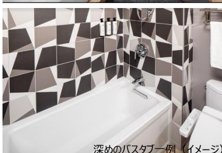
深めのバスタブ一例 (イメージ)