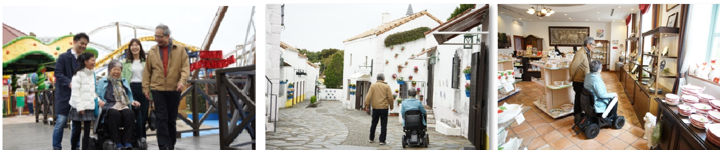
（写真はイメージです）

日本一広いテーマパークであるハウステンボスの場内を散策されるご高齢の方や長距離歩行に不安をお抱えの方も、WHILLをご利用いただく事で楽しく快適にお過ごしいただけることと思います。