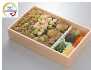
対象となる商品の一例 (駅弁類)

(1) おむすび処 米'n 八重洲南口店 導入場所：東京駅八重洲南口コンコース 営業時間：[通常] 6:30~22:00 [短縮] 6:30~14:00 ※3/26 現在 開始日：4月1日(木) 対象商品：駅弁・おにぎり等 割引率：50% 運営会社：ジェイアール東海パッセンジャーズ