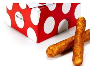
対象となる商品の一例 (パン類)

(2) デニッシュバー JR 名古屋駅店 マーメイドカフェ JR 名古屋駅店 導入場所：名古屋駅中央コンコース 営業時間：デニッシュバー 10:00~21:00 マーメイドカフェ [通常] 7:00~23:00 [短期] 7:00~21:00 ※3/26 現在