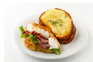
対象となる商品の一例 (パン類)

開始日：4月1日(木) 対象商品：デニッシュバー各種等 割引率：30% 運営会社：ジェイアール東海フードサービス ※デニッシュバーは2020年11月から実証実験での導入実績有り