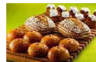
対象となる商品の一例 (パン類)

(3) 名古屋マリオットアソシアホテル ロビーラウンジ「シーナリー」 導入場所：名古屋マリオットアソシアホテル 15F 営業時間：11:00~19:00 開始日：4月1日(木) 対象商品：「シーナリー」内「ペストリーブティック」の パン・ポーションケーキ・焼き菓子 (テイクアウトのみ) 割引率：20%~40% 運営会社：ジェイアール東海ホテルズ