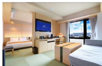
スイートルーム（イメージ）