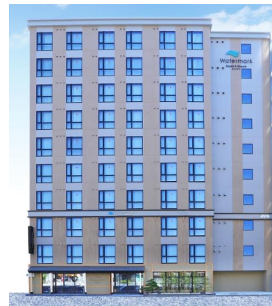
ホテル外観（イメージ）

「ウォーターマークホテル京都」は、「水」や「ブルー」をテーマとした「伝統的な和の世界観を体感」できる空間を演出いたしました。HIS.H.H.が運営するホテルとして、京都地区2拠点目となり、レジャー・ビジネスなど幅広いお客様層にご満足いただけるよう、京都ならではの絶好のロケーションと日本の伝統が一体化した京都だからこそ味わう事ができる唯一無二のくつろぎを、館内・客室の高品質と快適さを兼ね備えたワンランク上のサービスを国内外のお客様へ提供してまいります。