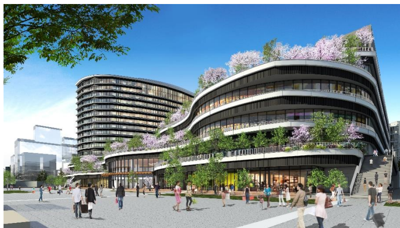
建物外観イメージ