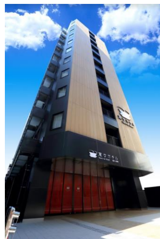
変なホテル大阪 心斎橋 外観(イメージ)

シャープ社によって開発されたロボホンズが19体でお出迎えいたします。多言語にてご挨拶や季節、時間合わせ様々なダンスを繰り広げます。