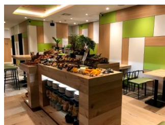
レストランは自然感を表したデザイン(イメージ)