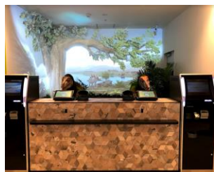
フロントプロジェクションマッピング(イメージ)