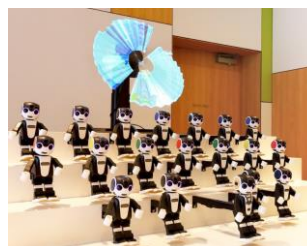
シャープ社 ロボホンズ(イメージ)