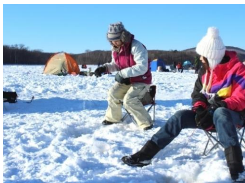
▲氷上わかさぎ釣り体験

アジア諸国においては本国では見ることができない「雪」を使ったアクティビティが、この時期、非常に注目されています。新千歳空港からのLCCやチャーター便の就航増加に伴い、道内で体験できる『氷上ワカサギ釣り』やスノーアクティビティに予約が集中しております。その他、滞在先近辺の施設、宿泊先や最寄り駅からの送迎付きの体験プランが人気となり、移動時間を短縮し、時間を有効活用したいという旅行者のニーズが伺えます。