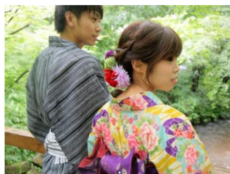
▲着物レンタルはカップルでの参加も人気