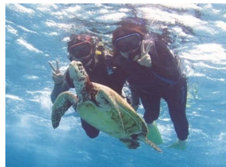
▲沖縄の美しい海で、ウミガメと一緒に泳ぐ

定番の『着物・浴衣レンタル』体験は、特にアジア便の就航が多い福岡空港を基点とした九州地方への旅行者に多く、中でも大分県湯布院周辺の着物レンタルは「温泉」目的の香港からの旅行者に旅の「すき間時間」を利用し手軽に体験ができることから不動の人気となっております。また、日本のテレビ番組やコミュニティサイトなど、一般情報サイトから旅の情報を得る傾向が高いタイの旅行者においては、「KIMONO」での検索が圧倒的に多く、且つおなじみの観光地である浅草、鎌倉で体験される方が多く見られます。