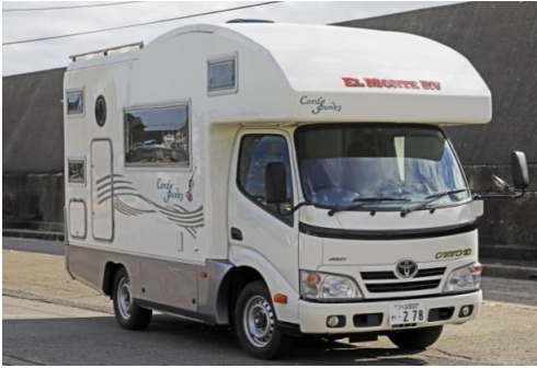
▲キャンピングカーは旅のワクワク感を創造してくれる

その他、既存の体験プランに加え、北海道のみならず、各地のスキー場やアウトドア施設を目指す交通手段の一つとして、現在アクティビティジャパンでも紹介中の「レンタルキャンピングカー」は、訪日旅行者からの長期間のお問い合わせやご予約が増加しております。電車やバスといった公共交通機関とは異なり、個室の空間で道中の旅の同行者との会話も楽しめる非日常空間は、自由度を求める個人旅行者にとって、利便性と非日常体験がマッチした新しい旅のスタイルとして受け入れられています。