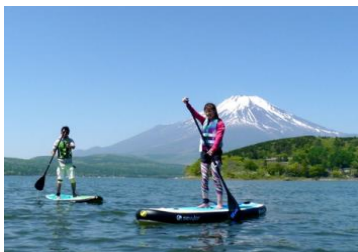
▲富士山をバックに SUP 体験

アクティビティジャパンでは、SUP以外にも定番のシュノーケリング、パラグライダー、日本伝統文化体験、農業体験など、様々なプランを取り扱っており、中でも日本各地の絶景を楽しみながらのアウトドア体験は「フォトジェニックな体験」を求める国内外のお客様より多くの支持を頂いております。当社外国語サイト(英語、繁体字、タイ語)からの訪日観光客(特に台湾・香港籍)からのご予約は、昨年同月の約10倍の予約数と大幅な伸びを見せており、観光地周辺の陶芸体験、もの作りなどのカルチャー体験と共に、団体ツアーのフリータイム『すきま時間』を利用した「旅ナカ」体験の需要は、今後も益々、高まることが予想されます。