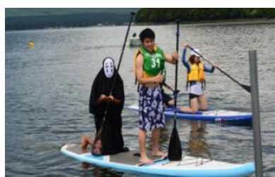
▲今年もあります！ベストパフォーマンス賞