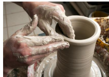
▲全国 陶芸体験は国籍問わず人気