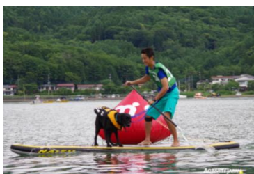
▲ドッグ SUP（ワンちゃんと一緒に） （※2016年第2回イベント時の様子）

第3回目の今年は「アクティビティジャパン杯」として、当社の強みとする訪日観光客の誘致強化を図り、更なる地域活性化に貢献できるよう目指します。アクティビティジャパンではSUPを初めとする様々な「体験」を通じ、心と心のふれあいによる、気づき、学び、自然の中での感動体験を通して芽生える“感情”を創出させると共に、各地域との連携をさらに密なものにし、国籍、年齢を問わず、より多くの観光に訪れる人々に「日本」を楽しんで頂く為の活動を今後も展開して参ります。