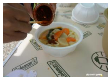
▲イベント後は地元名産の「ほうとう」を

※特設ページ http://activityjapan.com/feature/2017_supermarathon/