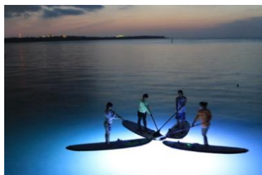
▲沖縄 幻想的なナイト SUP はトレンド