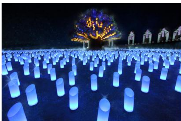
▲シンボルツリーとランタンイルミネーション「光の草原」