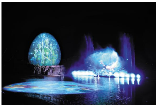
▲ウォーターマッピングショー「AGUA(アグア)」