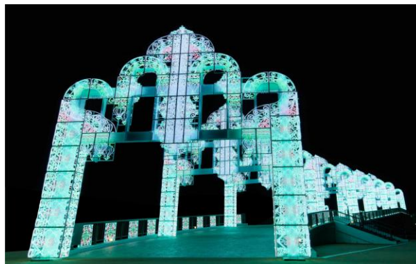
▲100万球のイルミネーションアーチ「幸運のレインボーアーチ」