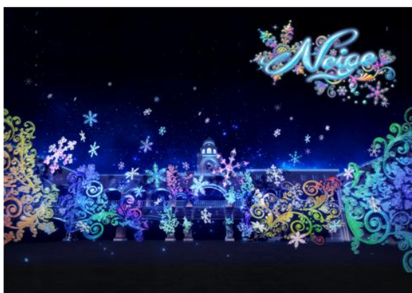
NEW ▲360° 3D マッピング「NEIGE(ネージュ)」 ※イメージ