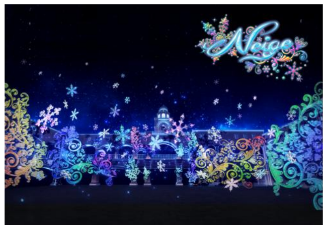
<360°3Dマッピング「NEIGE(ネージュ)」>