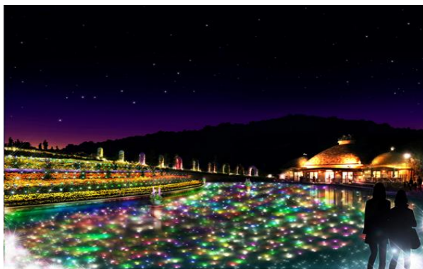
NEW ▲フラワーイルミネーション「ジュエルガーデン」 ※イメージ