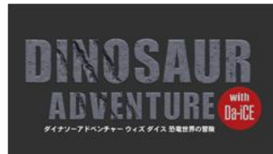
▲アトラクションロゴ