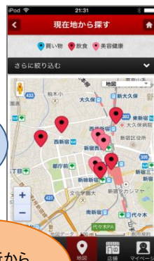
お客様アプリ画面（イメージ）