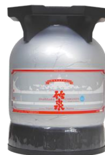
「竹泉 KEG DRAFT Nigori Sparkling」▲

今回、日本酒の酸化と紫外線による変化を防ぎ、長時間しぼりたての風味やフレッシュ感をそのまま維持し提供できる仕組みの特許を持つクリップクリエイティブが展開する「KEG DRAFT SAKE」を、HIS の海外ネットワークを活用することで、より多くの人に作りたての味をそのまま世界へ提供することが可能になります。