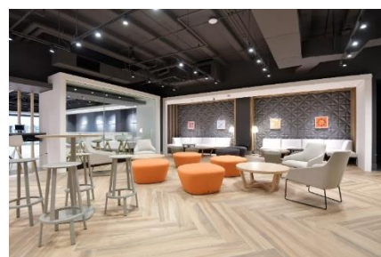
LeaLea ラウンジイメージ

ハワイを訪れる観光客は、個人旅行者が41.2%（出典：Hawaii Tourism Authority）を占めており、年々個人旅行の需要が増加傾向にあります。LeaLea ラウンジでは、その多様なニーズにお応えするため、個人旅行者向けの専用スペースを従来の約1.5倍に拡大し、ハワイでの個々のニーズに対応した、多彩な過ごし方をご提案いたします。この LeaLea ラウンジを通して、ハワイにお越しのお客様がそれぞれのハワイを発見し、かけがえのない思い出をつくっていただけるよう、お手伝いしてまいります。