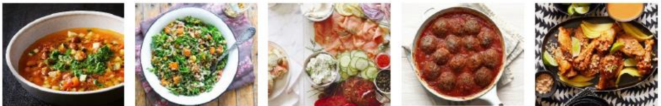
(ワイキキ・クラブ・ラウンジ内「Búho Cantina」のケータリングサービスイメージ)

ワイキキ・クラブ・ラウンジは、5,609スクエアフィート(521平米/157.6坪)のスペースからなる、アーバンリゾートのビーチハウスをイメージして造られたホノルルエリア最大級のラグジュアリーラウンジです。立地抜群のワイキキ中心で、ショッピング中の休憩や、待ち合わせなど、ゆったりお寛ぎいただける場所としてご活用いただくことが可能です。7月より、地元で人気のメキシカンレストラン「Búho Cantina」の軽食ケータリングサービス、ドリンクを無料で提供する他、今夏には、バーテンダーによるアルコールの提供(一部有料)を予定しています。