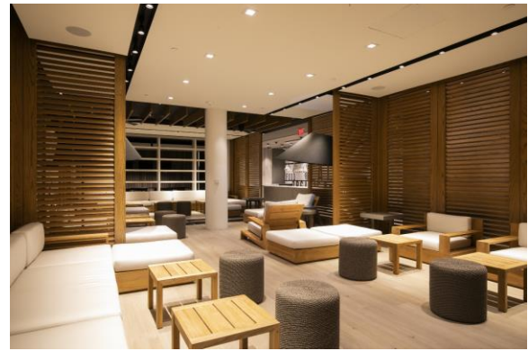
(ワイキキ・クラブ・ラウンジ内装イメージ)

H.I.S.はハワイのワイキキで、「ヒルトン・ハワイアン・ビレッジ」「ロイヤル・ハワイアン・センター」「ワイキキビーチ・マリオット」内の3拠点にツアーラウンジを展開しており、当社のツアー参加のお客様にむけて、日本人スタッフによる旅行中のご相談やオプションツアーの手配などのサービスを中心に提供しています。このたびオープンするワイキキ・クラブ・ラウンジでは、H.I.S.が取り扱う海外ウェディングの「Avanti and Oasis (アバンティ&オアシス)」、ビジネスクラスのツアー「Extage (エクステージ)」のブランドご利用のお客様と、こだわりと上質なサービスを提供する「QUALITA (クオリタ)」のツアー、クルーズ専門の旅行を提供する「Cruise Planet (クルーズプラネット)」の他、パッケージツアー「Ciao (チャオ)」一部のプレミアム商品を含むお客様に限定し、ラウンジサービスをご提供します。今後クレジットカードの上級会員などH.I.S.以外のお客様に対してもサービスを展開する予定です。