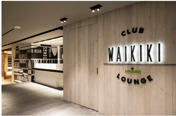
(ワイキキ・クラブ・ラウンジ入り口イメージ)

株式会社エイチ・アイ・エス(本社:東京都新宿区、以下 H.I.S.)は、ハワイ・ワイキキの中心部にある「T ギャラリーハワイ by DFS」内にて、「Waikiki Club Lounge by LeaLea (以下、ワイキキ・クラブ・ラウンジ)」を、2019年6月1日にオープンします。