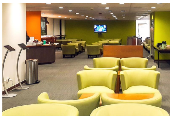
(LeaLea エアポートラウンジイメージ)