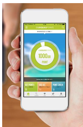
(LeaLea ポイントイメージ)