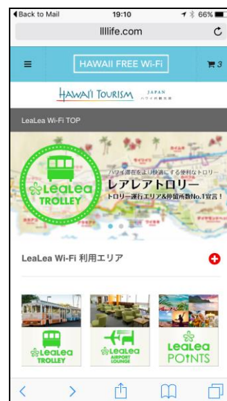
接続後 TOP 画面（イメージ）

「Hawaii Free Wi-Fi」は、約20秒の広告ムービーを視聴いただくことで、無料で1時間Wi-Fiに接続が可能となります。「LeaLea Wi-Fi」においては、ユーザーがLeaLeaポイントアプリ（※1）をスマートフォンにダウンロードいただき接続用パスコードを取得することで、1週間のWi-Fi利用が可能となります。また、それぞれのWi-Fiサイトからは、H.I.S.オリジナルサービス（LeaLeaトrolley、LeaLeaポイントアプリ、LeaLeaエアポートラウンジ）のご案内ページにも接続可能となり、ハワイでより快適な滞在をご提案いたします。