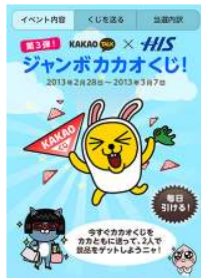
(カカオくじイメージ)