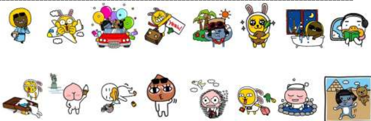
(カカオフレンズ×H.I.S. オリジナルスタンプイメージ)

『カカオトーク』(英語名:KAKAO TALK、 http://www.kakao.co.jp )は利用しているユーザー同士であれば国内・海外、通信キャリアを問わず、無料で音声通話・チャットが楽しめるスマートフォンアプリとして、日本をはじめ世界230以上の国や地域で8,000万人以上の方に利用されています。