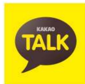
(カカオトークロゴ)