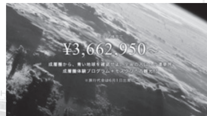
▲成層圏ツアー(独自の商品)