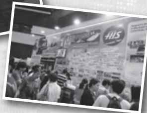
▶ タイ「トラベルフェア」▶