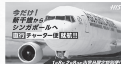
▲ アジア アトランティック エアラインズ ▼