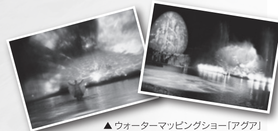
▲ウォーターマッピングショー「アグア」

平成26年8月より事業を承継しております新生ラグーナテンボスでは、ご好評いただいております日本初となる360°見渡せる3Dマッピング「ラルース」やウォーターマッピングショー「アグア」に加え、参加型で楽しめるマッピングイベント「フォトタス」を実施するなど、多くのお客様にご来場いただきました。