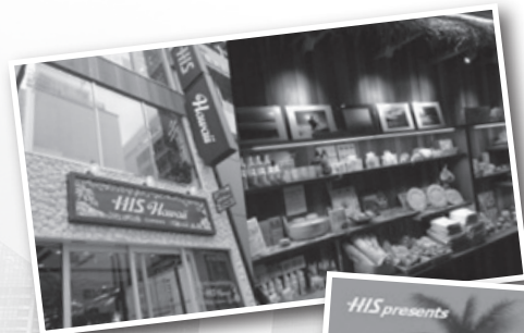
▲新宿三丁目ハワイ専門店