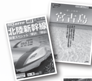
◀国内旅行パンフレット