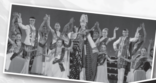
◀ハウステンボス 歌劇団