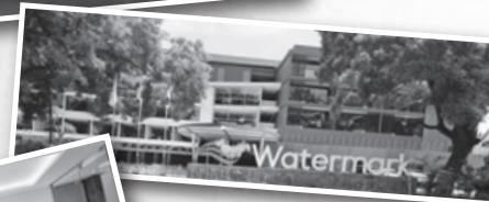
▲ ウォーターマークホテルバリ