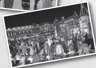
▲本場さながらの仮面舞踏会 「仮面舞踏会大カーニバル2015」

ハウステンボスでは、世界最大級の1,100万球超のイルミネーション「光の王国」が夜の園内を彩り、国内最多700品種が咲き誇る「チューリップ祭」では、新たに“有機EL”を使用した世界初の光るチューリップ約5,000本が音楽に合わせて幻想的な光のショーを演じるなど「オンリーワン・ナンバーワン」に拘ったイベントを繰り広げました。また、人気コンテンツのひとつとしての地位を確立しつつある「ハウステンボス歌劇団」も新演目を展開し、ご好評いただいております。そのほか、パーク全体で楽しめるイベント「仮面舞踏会大カーニバル2015」の開催など、お客様に感動いただけるよう様々な取り組みを実施した結果、入場者数が事業承継前と比較し2倍になるなど好調に推移いたしました。