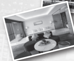
◀ ウォーターマークホテルバリ 客室

ウォーターマークホテル長崎では、客室単価の改善に加え、スイーツビュッフェがご好評いただくなど、各ホテルにてお客様満足や収益性向上に努めた結果、好調に推移いたしました。