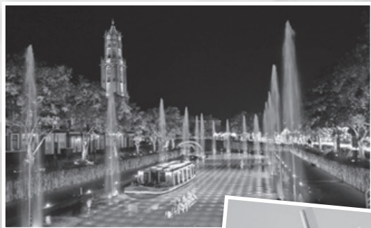
▲世界初の運河イルミネーション 「光の運河クルーズ」