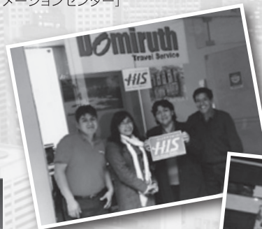
◀ マチュピチュウの玄関口 「クスコツアーデスク」