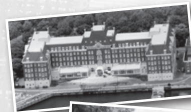
◀ ウォーターマーク ホテル長崎