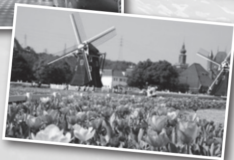
国内最多700品種の▶ 「チューリップ祭」