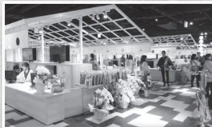
◀ 大阪心斎橋 「ツーリストインフォメーションセンター」