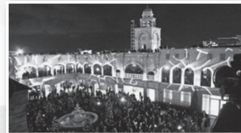
▲日本初!360°3Dマッピング「ラルース」