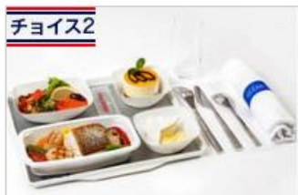
チョイス2 オーシャン・メニュー 新鮮な海の幸をつかったヘルシーメニュー。 通常15ユーロ追加⇒無料 ※東京⇒パリ間