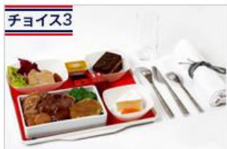
チョイス3 トラディション・メニュー フランスの本格的な伝統料理。 通常18ユーロ追加⇒無料 ※東京⇒パリ間