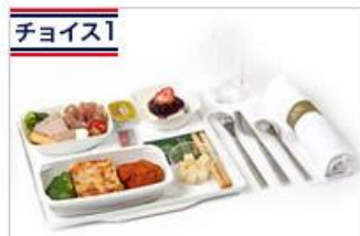
チョイス1 イタリアン・メニュー 本格的なイタリア料理。 通常12ユーロ追加⇒無料 ※東京⇒パリ間のみ

その他、店頭でエールフランス航空指定にてヨーロッパ行きの航空券をご購入のお客様には、通常有料のワンランク上の機内食「4つから選べるアラカルトメニュー」を無料で手配させていただくキャンペーンも実施いたします。