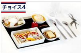
チョイス4 ジャン・アンベールのマルシェ フランス有名若手シェフが考案したメニュー。 通常21ユーロ追加⇒無料 ※パリ⇒東京間のみ

※2017年3月31日までのご予約かつ2017年5月5日東京発～2017年7月13日東京発・パリ発が対象。 ※往路又は復路のどちらかで1回ご選択いただけます。 ※往路・復路で選べるメニューが異なります。 ※一旦リクエストを承ると、メニューの変更はできません。